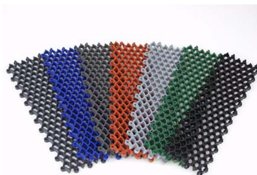
Paleta barev: černá, grafit, tmavě šedá, světle šedá, terracotta, modrá a zelená